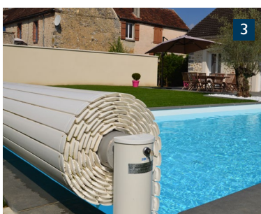
1 Couverture automatique hors sol totalement fermée. 2 Couverture automatique hors sol semi-ouverte. 3 Couverture automatique hors sol totalement ouverte.